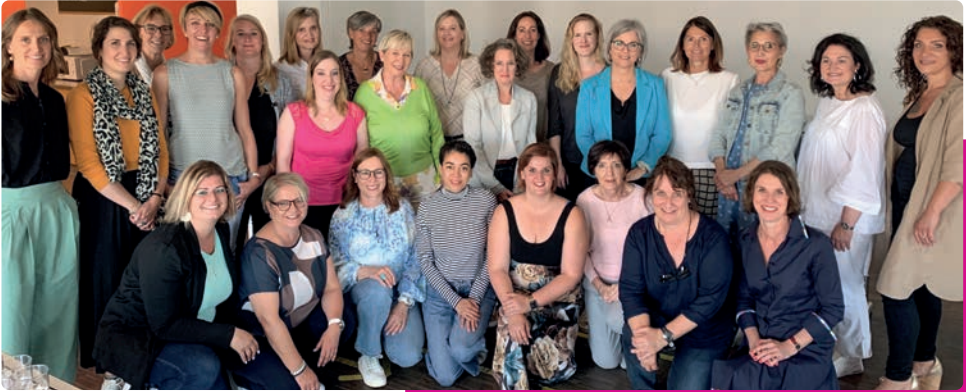
Ein Teil unserer Ehrenamtlichen

Über 100 Kosmetikfachfrauen engagieren sich mit viel Herzblut für die Durchführung der Workshops. Dafür möchten wir ihnen allen ganz herzlich danken.