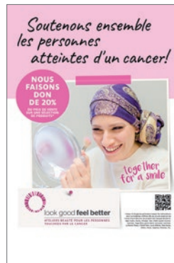
Campagne dans les magasins Manor

Du 11 au 24 octobre 2021, une campagne a eu lieu pour la deuxième fois dans toute la Suisse avec de nombreux partenaires de marque dans les magasins Manor et en ligne. 22 partenaires beauté et Manor ont fait don de 20 % à Look Good Feel Better sur des produits cosmétiques spécialement sélectionnés.