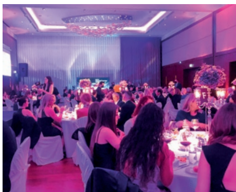
Duftstars Prix Suisse du Parfum 2021

Le 31 août 2021, l'événement Duftstars Prix Suisse du Parfum a eu lieu au Hyatt à Zurich. La fondation Look Good Feel Better est le partenaire caritatif officiel et a reçu un chèque de donation.