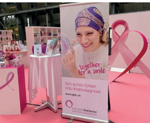
Actions caritatives d'Estée Lauder