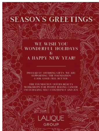
Donation de Noël Lalique

Au lieu d'offrir des cadeaux de Noël à ses clients, Lalique nous a apporté son soutien en faisant un don généreux.